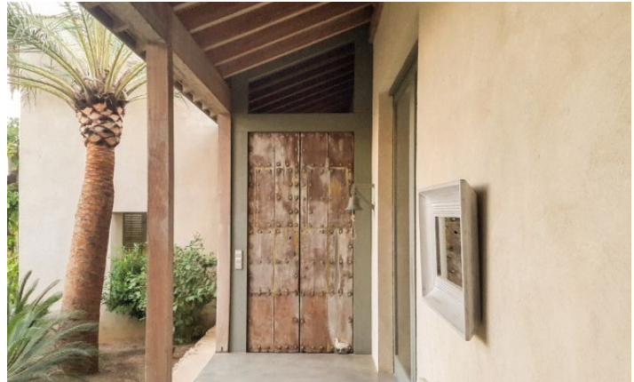
Figura 4. Vivienda unifamiliar. Vivienda en el Mediterráneo