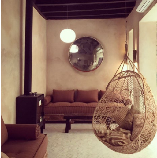
Figura 1. Vivienda unifamiliar. Sevilla

Los días de lluvia no es aconsejable aplicar mortero en el exterior, no es tóxico, no es inflamable, proteger los ojos, manos y piel en contacto directo