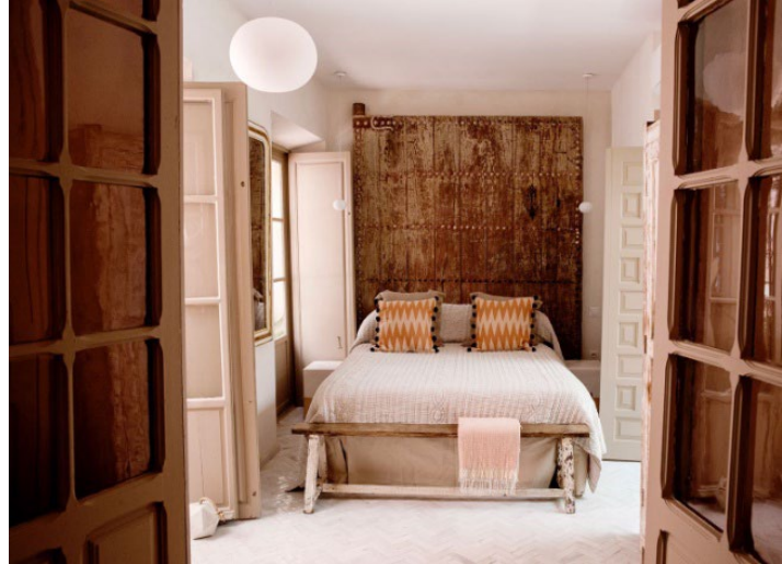
Figura 2. Vivienda unifamiliar. Sevilla