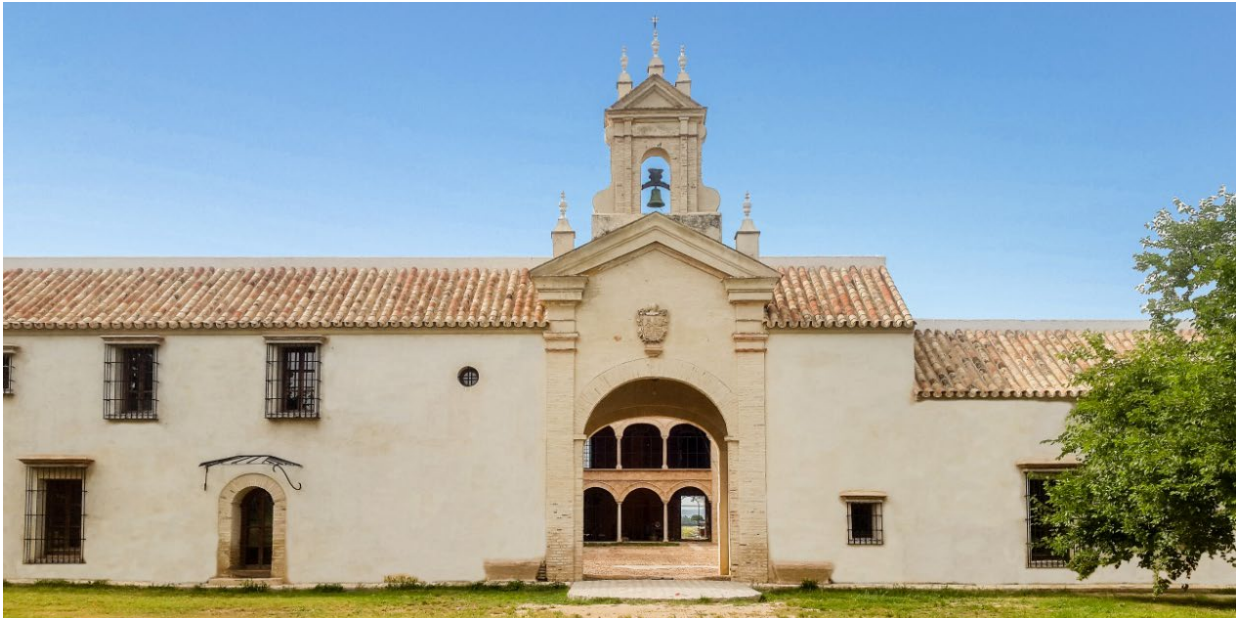
Figura 5. Cortijo Andaluz

Nuestras fichas técnicas son redactadas conforme a nuestros mejores conocimientos técnicos y prácticos. No siendo posible intervenir en las condiciones de las obras y en la ejecución de las mismas, citadas informaciones representan indicaciones de carácter general que no comprometen en modo alguno a CUMEN S.L. Nuestra empresa aconseja una prueba preventiva para verificar la idoneidad del producto para su uso preventivo. Las instrucciones de forma de uso se hacen según nuestros ensayos y conocimientos y no liberan al consumidor del examen o verificación de los productos para su correcta utilización. La empresa o persona encargada de usar nuestro material deberá establecer si su empleo es adecuado o no, pues asume la responsabilidad que pueda derivar de su uso. Nuestros productos están evaluados mediante ensayos iniciales de tipo, EIT determinando que son conformes con los requisitos de la norma UNE-EN_998-1.2016 (Norma Europea) y que la declaración de prestaciones representa el verdadero comportamiento del producto. Los ensayos iniciales de tipo permanecerán válidos para productos posteriores mediante el control de producción en fábrica integrado, CPF, fichas técnicas y ensayos realizados en laboratorios inscritos en el registro general de Laboratorios de Ensayos del Ministerio de la vivienda.