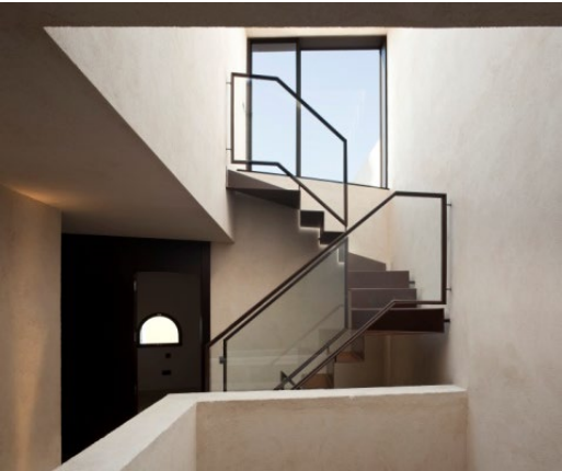
Figura 3. Vivienda unifamiliar. Sevilla