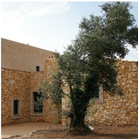
Figura 7. Vivienda unifamiliar aislada, Girona