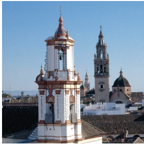
Figura 1. Espadaña de Santa Isabel Écija, Sevilla