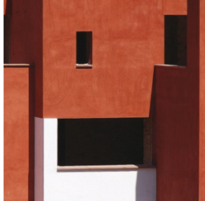
Figura 8. Vivienda unifamiliar el atabal, Málaga