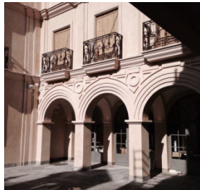
Figura 11. Restaurante Casa Moral. Los Palacios, Sevilla