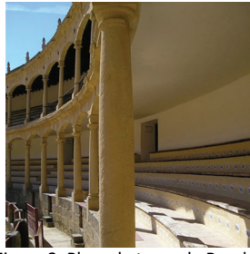
Figura 2. Plaza de toros de Ronda, Málaga