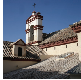
Figura 6. Iglesia del Convento de las Enclaves, Sevilla