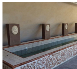
Figura 12. Restaurante Casa Moral. Los Palacios, Sevilla

Nuestras fichas técnicas son redactadas conforme a nuestros mejores conocimientos técnicos y prácticos. No siendo posible intervenir en las condiciones de las obras y en la ejecución de las mismas, citadas informaciones representan indicaciones de carácter general que no comprometen en modo alguno a CUMEN S.L. Nuestra empresa aconseja una prueba preventiva para verificar la idoneidad del producto para su uso preventivo. Las instrucciones de forma de uso se hacen según nuestros ensayos y conocimientos y no liberan al consumidor del examen o verificación de los productos para su correcta utilización. La empresa o persona encargada de usar nuestro material deberá establecer si su empleo es adecuado o no, pues asume la responsabilidad que pueda derivar de su uso. Nuestros productos están evaluados mediante ensayos iniciales de tipo, EIT determinando que son conformes con los requisitos de la norma UNE-EN_998-1.2016 (Norma Europea) y que la declaración de prestaciones representa el verdadero comportamiento del producto. Los ensayos iniciales de tipo permanecerán válidos para productos posteriores mediante el control de producción en fábrica integrado, CPF, fichas técnicas y ensayos realizados en laboratorios inscritos en el registro general de Laboratorios de Ensayos del Ministerio de la vivienda.