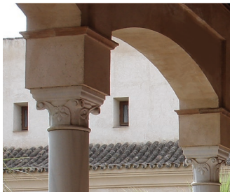
Figura 5. Palacio Marqueses de la Algaba Sevilla