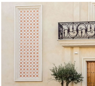
Figura 10. Restaurante Casa Moral. Los Palacios, Sevilla