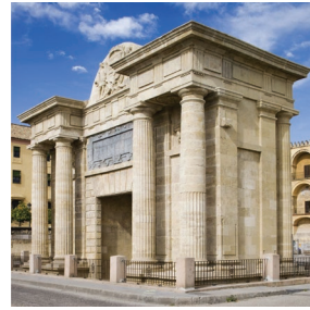
Figura 3. Puerta del puente, Córdoba