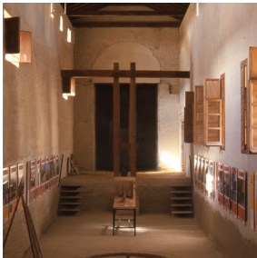
Figura 4. Molino de la hacienda de Miraflores, Sevilla